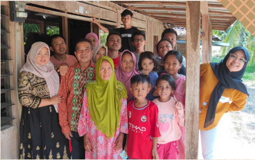
Foto diatas merupakan foto keluarga besar bersama kakek nenek dan saudara lainnya, foto itu diambil pada saat hari raya idul fitri kemarin

saya tinggal bersama ayah, mama dan abang , saya anak kedua dari 2 bersaudara. ayah saya berumur 40 tahun dan bekerja sebagai wiraswasta, mama saya berumur 38 tahun dan dia bekerja sebagai wiraswata juga, abang saya berumur 17 tahun dia kelas 3 SMA